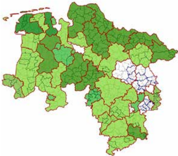
Daten der Landkreise